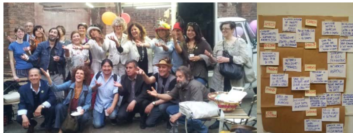
Marzo 2015, consultazione nelle zone di decentramento