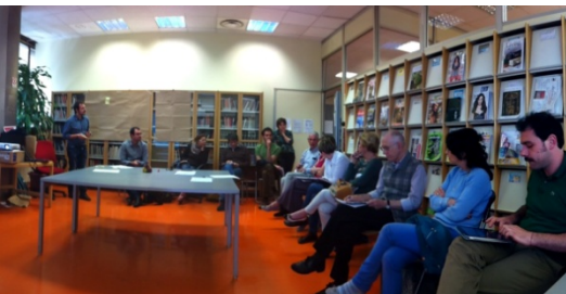
Marzo 2015, consultazione cittadini nelle biblioteche