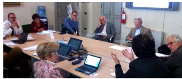
Ottobre 2014, gruppi di approfondimento settoriali