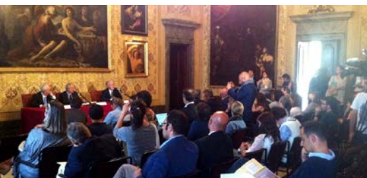
10 luglio 2014, conferenza stampa avvio Food Policy