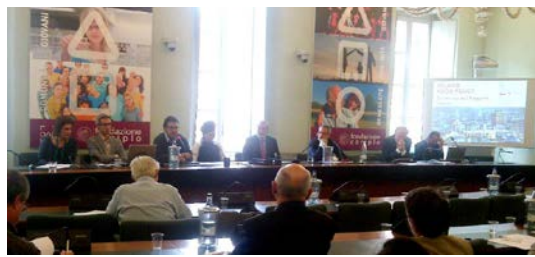
Settembre 2014, consultazione università