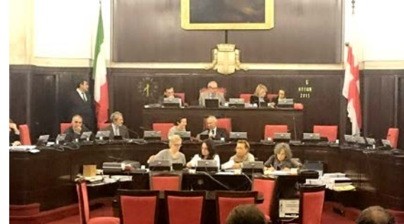
5 ottobre 2015, voto in Consiglio Comunale