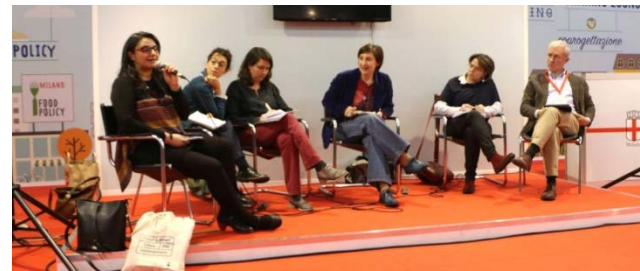
Aprile 2015, dibattiti e confronti pubblici