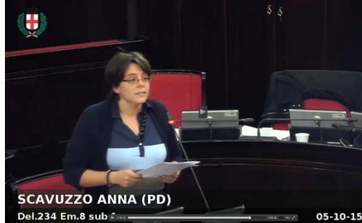
Ottobre 2015, dibattito in Consiglio Comunale