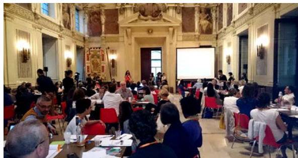
14 giugno 2015, Town Meeting per selezionare le priorità